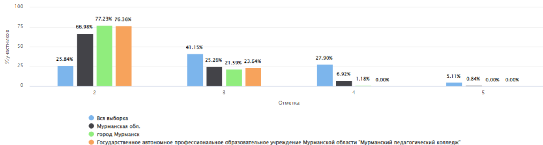
Распределение групп баллов(%)