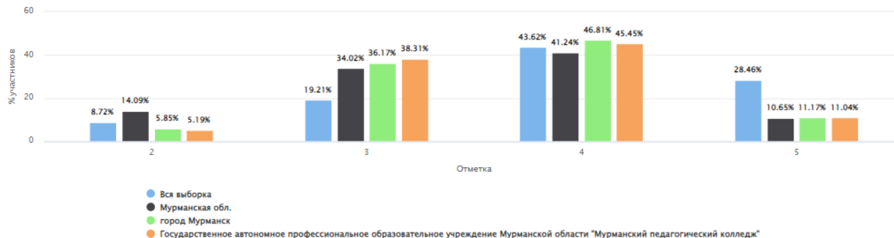
Распределение групп баллов(%)